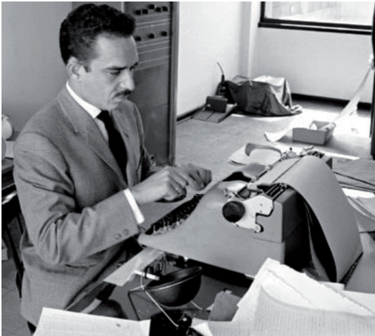
G. GARCÍA MÁRQUEZ, Bogotá 1959.

García Márquez, ya lo tenemos al frente.